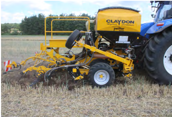
Bei Claydon wird das Saatgut in breiten Bändern abgelegt.

schützen den Ackerboden vor Verdichtung, Austrocknung sowie Wasser- und Winderosion (-98 % Bodenverlust durch Erosion). Seine biologische Aktivität wird gefördert (+400 % Pilze, Regenwürmer; +150 % Bakterien), seine Struktur und damit die Befahrbarkeit verbessert und der Humusgehalt gesteigert oder zumindest erhalten.