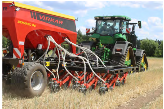
Die Direktsämaschine Dynamic D von Virkar hat hinten eine Lenkachse. Sie entlastet bei Kurvenfahrten die Schararme, was zu einer geringeren Belastung der Komponenten führt.

kommen. Viele Landtechnikhersteller arbeiten in der Direktsaat mit Zinken- oder Scheibenscharsystemen.