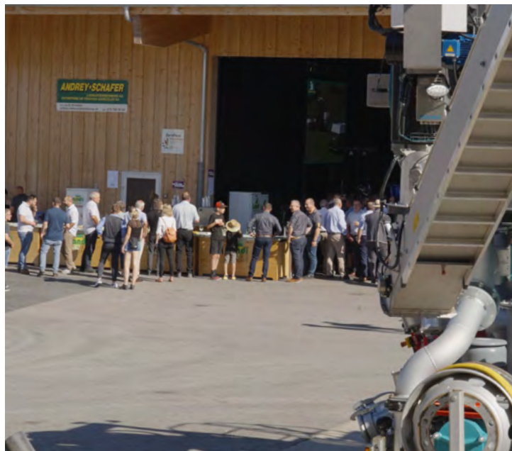
Wenn Lohnunternehmer feiern, dann ist die Technik nicht weit: Gut kombiniert mit einem feinem Apéro. Herzlichen Dank an das Catering-Team.