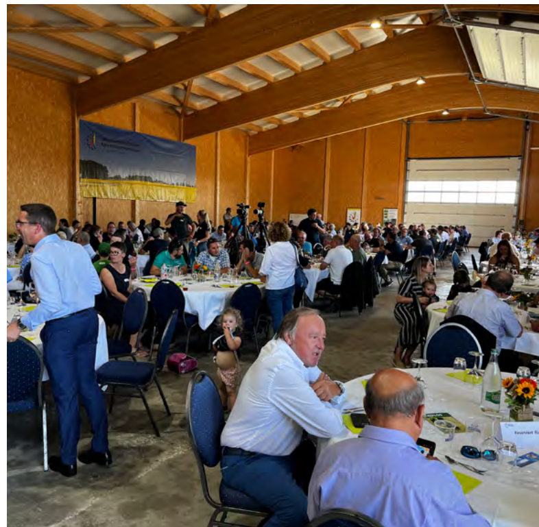
Blick in die wunderbar dekorierte Halle. Die Gäste genossen die Atmosphäre mit ländlichem Ambiente bis zum späten Abend. Der Vorstand freute sich über die gute Resonanz. Wir bedanken uns bei allen für das Kommen und die Geschenke.