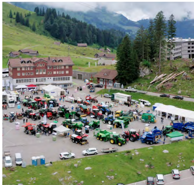
Ein gelungenes Fest auf der Schwägalp.

Anfangs wurde die Siloballenfolie mehrheitlich für den Eigengebrauch gekauft, heute machen der Folien-Import und -Handel den grössten Teil des Unternehmens aus. Die Bruno Aemisegger AG hat sich auf den Handel mit Siloballenfolie, Mantelfolie und Rundballennetz spezialisiert und gehört seit Jahren zu den Marktführern in dieser Nische.