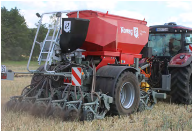
Der T-ForcePlus 250 von Novag reicht je nach Scharanzahl eine Traktorleistung von 80-130 PS.

um zwei weitere Prinzipien ergänzt: die Integration von Tierhaltung und ganzjährige Bodendurchwurzelung.