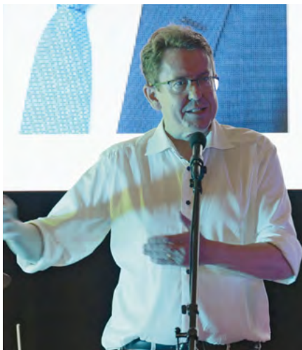
Bundesrat Albert Rösti weiss um den überbordenden Bürokratismus.