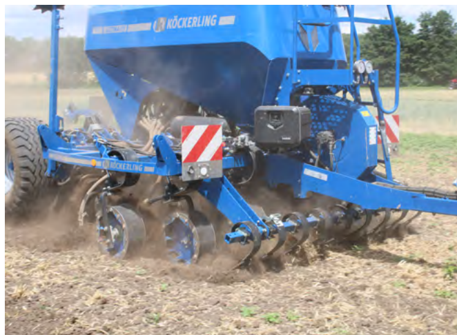
Bei der Ultima CS von KÖCKERLING haben die 6 cm breiten Saatbänder einen Abstand von 18,5 cm.

In der Sätechnik hat sich beim Angebot der Hersteller viel getan. Wie zum Beispiel das Mehr-Tanksystem bei den diversen Modellen, mehr Schlagkraft durch höhere Geschwindigkeit und/oder grössere Arbeitsbreiten und damit mehr aufgesattelte Geräte, um die Achslastprobleme der Traktoren zu lösen. Neben der klassischen Drillkombination mit Kreisel-egge bzw. Kreiselgrubber plus Sämaschine geht der Trend zur Mulch- und Direktsaat. Hier stellvertretend einige Beispiele: Die Firma Novag mit dem neuen Model T-ForcePlus 250: Die Geräte sind mit dem einzigartigen Novag T-SlotPlus Scharsystem ausgestattet, bestehend aus dem Kreuzschlitzschar T-ForcePlus und der automatischen Schardruckregelung IntelliForcePlus. Mit hohen Schardrücken von bis 500 kg dringt das Schar durch jede Mulchschicht und in jeden noch so festen Boden und dank der automatischen Schardruckregelung soll eine sehr gleichmässige Ablagetiefe erreicht werden. An jedem Säbalken ist jeweils ein Schar mit einem Sensor aus-