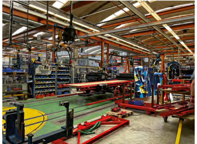
Rundgang bei Pöttinger. Blick auf das Montageband. Pöttinger ist ein Familienunternehmen in der vierten Generation. Der Hauptstandort ist im österreichischen Grieskirchen.