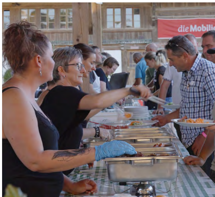
Rund 300 Gäste genossen ein feines Esses vom Grill. Zum Nachtisch gab es der Region entsprechend Meringue und Doppelrahm: Das ist traditionelle Esskultur à la fribourgeoise!