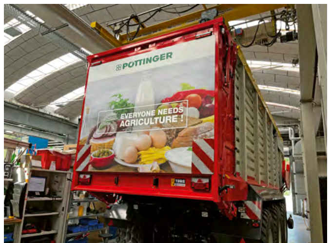
Ladewagen kurz vor der Auslieferung.