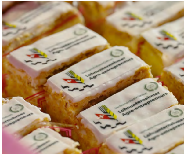
Das Logo des Verbandes erhielt Anfang des Jahres einen neuen Anstrich. Es performte auch auf der Cremeschnitte perfekt, auch geschmacklich ein Genuss.