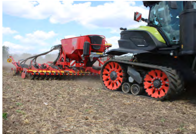
Die Spirit 600S von Väderstad ist mit einem aktiven hydraulischen Schar-drucksystem für eine exakte Ablagetiefe ausgestattet.

gestattet, der 50 000 Mal in der Sekunde den Schar-Druck misst und in Echtzeit auf den vorgegeben Zielwert nachregelt.