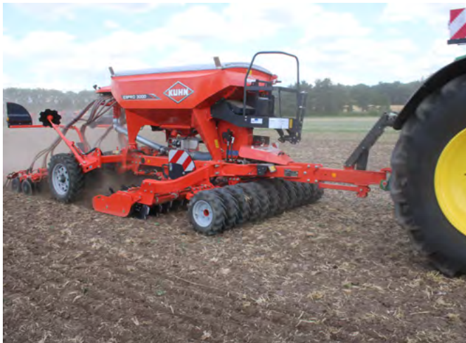
Espro: Die verstellten Räder des Reifenpackers sollen ein Aufschieben von Erde verhindern und damit den Zugkraftbedarf senken.

Die Claydon Direktsaatmaschine funktioniert nach dem Prinzip Striptill und besitzt ein Zweitanksystem. Dabei wird nur in