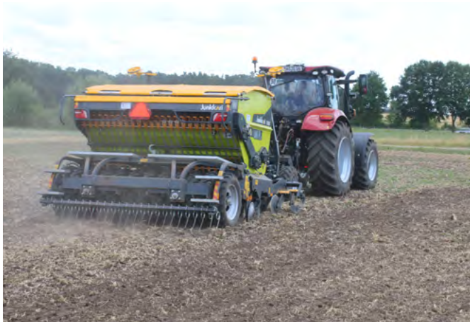
Die Kombisämaschine T300 von Junkkari ist für schwere Böden entwickelt worden.