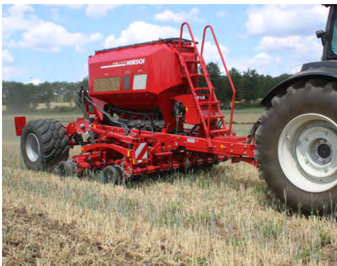
Bei der Avatar von Horsch befindet sich die Tiefenführungsrolle des Schar direkt am Särschar.

Die Technik und auch die Konzepte haben sich in den vergangenen Jahren deutlich verändert. Welche dieser Systeme können für die vielfältigen Probleme und Herausforderungen in der Landwirtschaft Lösungen bieten? Die Direktsaattechnik muss mit festen Böden und dichten Multschichten zurecht-