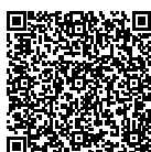
Das Video zum Jubiläumsfest mit den schönsten Eindrücken. Merci Simon Möri für deinen Einsatz.