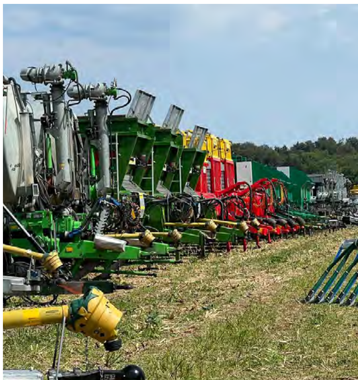
Es ist Tradition den jährlichen Grillplausch bei einem Lohnunternehmer zu organisieren. Spannend ist, dessen Technik zu beäugen. Schön aufgereiht Gülletankwagen, Kipper, Ladewagen.

Das Jubiläumsfest des Verbandes Lohnunternehmer Schweiz sollte ein Zeichen sowohl intern als auch extern setzen. Die Zielrichtung und der eingeschlagene Weg der vergangenen Monate sind deutlich spürbar: Der Verband will als professionelle Institution und Partner auf Augenhöhe wahrgenommen werden, und zwar in allen Belangen, was die Technologisierung, Nachhaltigkeit und Ökologie angeht. Schlussendlich spielt er einen wichtigen Part bei der Schweizer Nahrungsmittelversorgung. Bundesrat Albert Rösti und die Freiburger Ständerätin Johanna Gapany unterstreichen in ihren persönlich überbrachten Grussworten den Willen der Politik, gleichwohl eine Veränderung der aktuellen Ausrichtung der Landwirtschaft herbeizuführen, aber dies in Zusammenarbeit mit den Lohnunternehmerbetrieben. Deshalb werden wir in den kommenden Jahren uns noch mehr konstruktiv einmischen, mit diskutieren und progressive Lösungen vorschlagen.