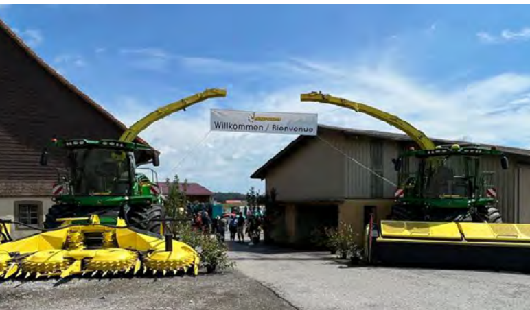
Dem Berufsstand angemessen wurden die Gäste auf dem Hof des Lohnbetriebes Andrey und Schaffer in Arconciel empfangen.