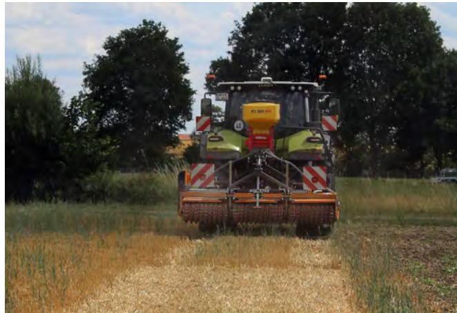
Die Coverseed von Müthing legt das Saatgut unter die Mulchschicht.

Bei konsequenter Umsetzung der Direktsaat-Prinzipien sind, darin sind sich die Fachleute der konservierenden Landwirtschaft einig, die Pflanzenbestände erkennbar vitaler und gesünder, so dass Pflanzenschutzmitteleinsatz und Düngenniveau im Laufe der Umstellung immer weiter reduziert werden können. Das reduziert Kosten bei Betriebsmitteln, Arbeitszeit und Maschineneinsatz um durchschnittlich 50%. Internationale Studien belegen der Direktsaat sogar eine ausgeprägtere Biodiversität bei Insekten und Vögeln als ökologisch bewirtschafteten Flächen. Selbst der Naturschutzbund hat kürzlich ein Positionspapier zum Thema Regenerative Agriculture herausgegeben, in dem er sich für eine Ausnahme der Glyphosat-Anwendung ausspricht, sofern Regenerative Agriculture und